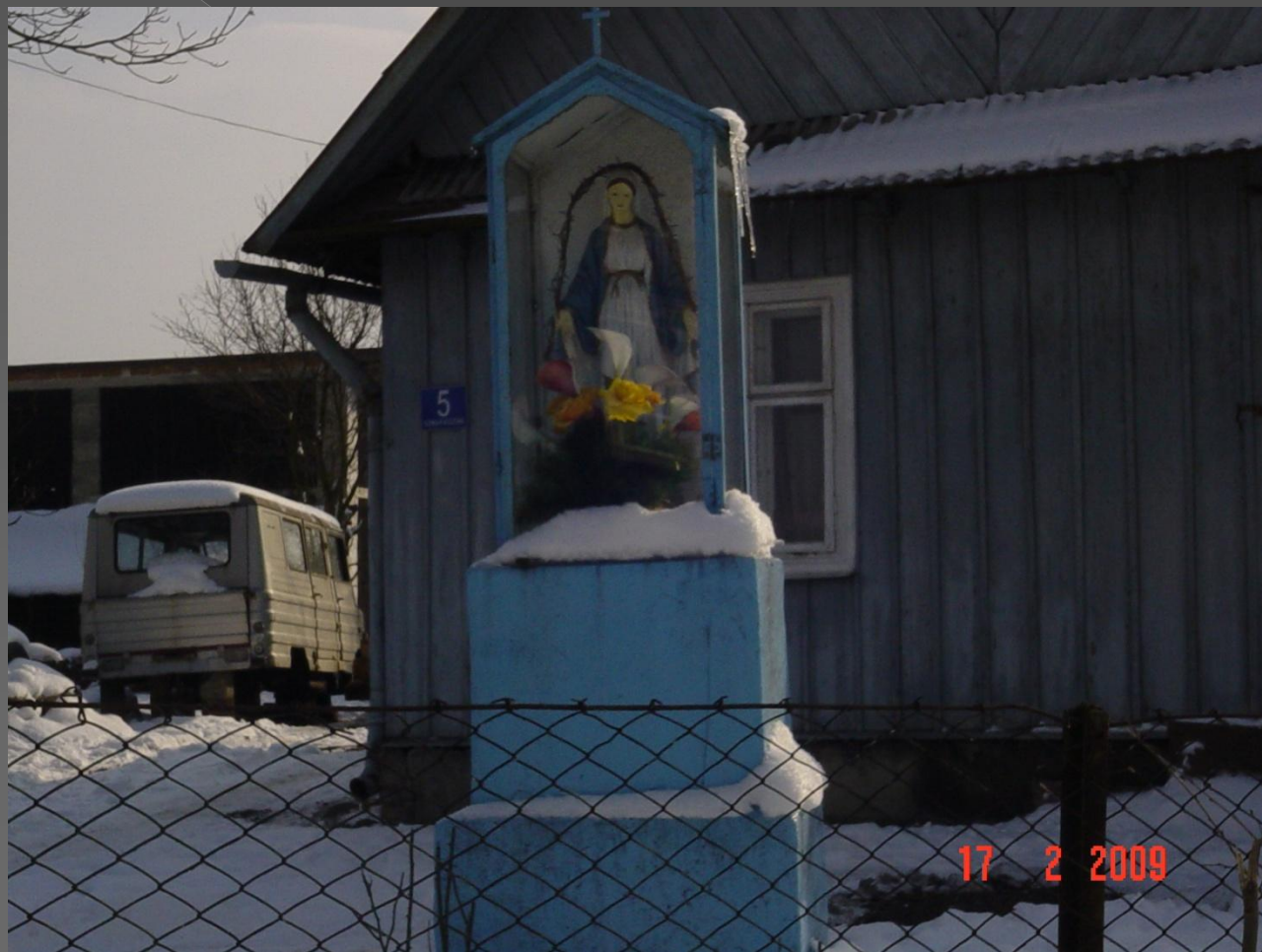
Kapliczka Matki Boskiej Niepokalanie Poczętej 1937 rok